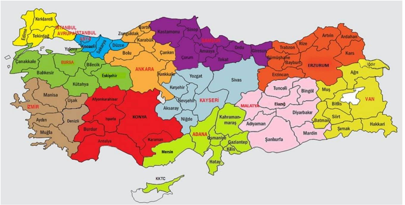
Şekil 1. Yarışma Bölgeleri Haritası

Bu yarışma Türkiye genelinde 12 bölgede yapılmaktadır. Her bölge için bir il, merkez olarak seçilmiştir. Her bölgeye il merkezinden iki öğretim üyesi, TÜBİTAK tarafından yarışmalardan sorumlu Bölge Koordinatörü ve Bölge Koordinatör Yardımcısı görevlendirilir. Adana, Ankara, Bursa, Erzurum, Konya, İstanbul Asya, İstanbul Avrupa, İzmir, Kayseri, Malatya, Samsun ve Van bölge merkezi illerdir. İllerin bölgelere dağılımları Şekil 1'de verilmiştir.